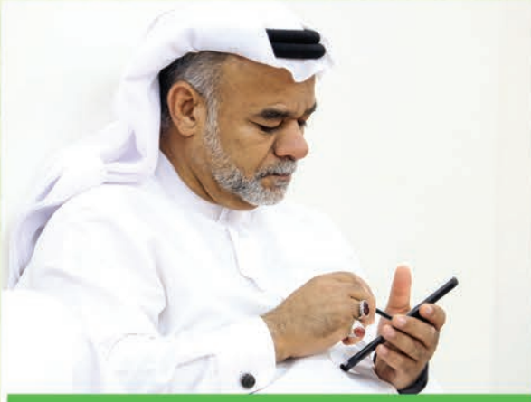
ليش مورا ضيين يروحون الصور في لقروب