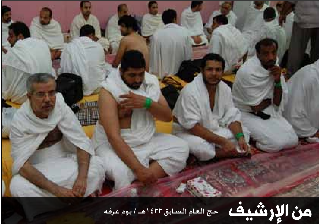
من الإرشيف | حج العام السابق ١٤٣٣ هـ / يوم عرفه

ما أعظم هذه الأيام؟! موسى (ع) يذهب إلى الطور وفاطمة عليها السلام تُزف إلى بيت علي (ع) وإبراهيم يذهب بإسماعيل ليفتدي به ومحمد (ص) يذهب مع علي(ع) إلى الغدير والحسين(ع) بكل وجوده يسير إلى كربلاء ومهديّ الزهراء عجل الله فرجه يتوجه بالحجيج إلى عرفة. كم من فضيلة لهذه الأيام.. مضمونة فيها استجابة الدعاء نسألکم الدعاء