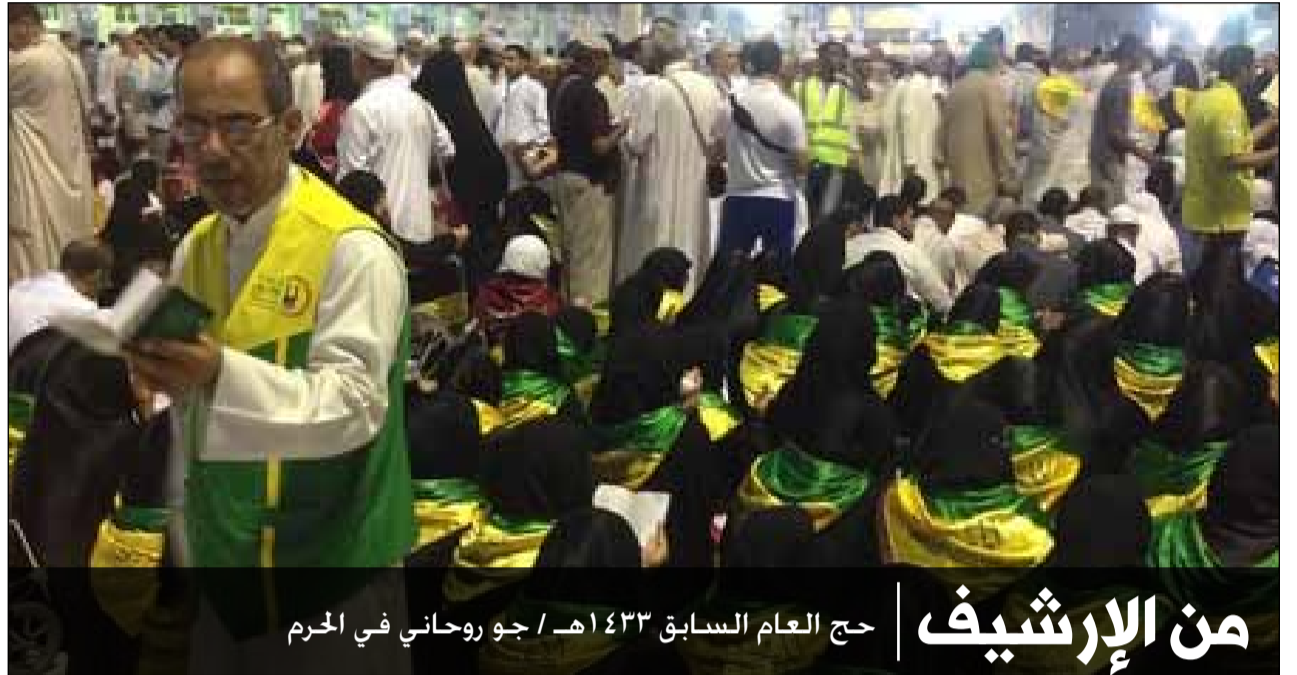
من الإرشيف | حج العام السابق ١٤٣٣ هـ / جو روحاني في الحرم