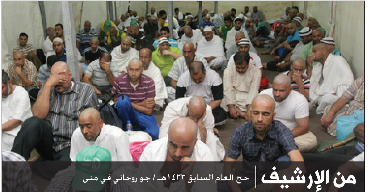
من الإرشيف | حج العام السابق ١٤٣٣ هـ / جو روحاني في منى