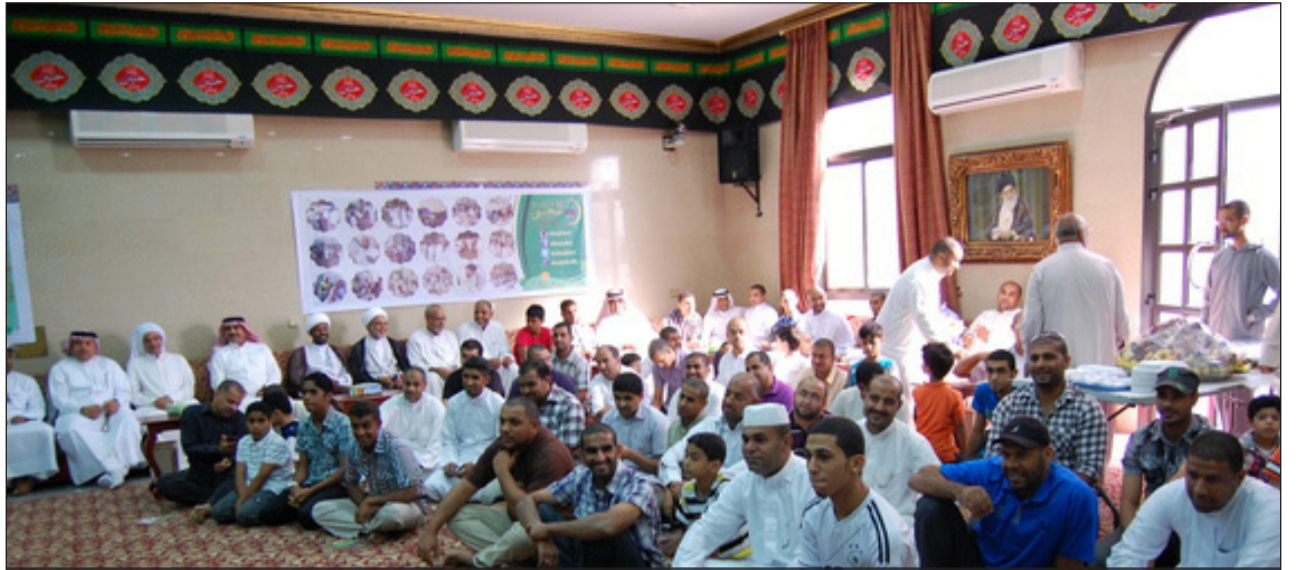
ارشيف | من لقاء حجاج العام الماضي في حفل مصغر ووجبة غداء تم خلال الحفل السحب على جوائز قدمت للحجاج منها رحلات إلى مدينة مشهد والعمرة والمدينة