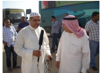
ها.. حجي شخبارك؟