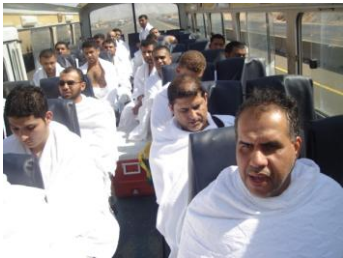
ليبيك أهل التلبية لبيك

بث مباشر على الانترنت ستبث اللجنة الاعلامية المحاضرات الارشادية وبعض الأنشطة بثاً مباشراً على شبكة الانترنت، موقع القافلة www.almoitaba.bh