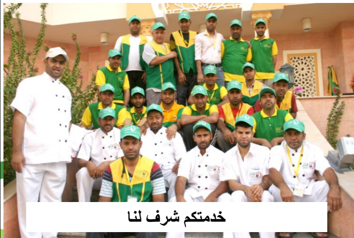
خدمتكم شرف لنا