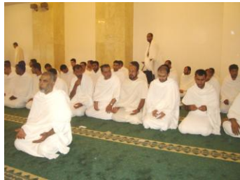
صلاة جماعة في الميقات