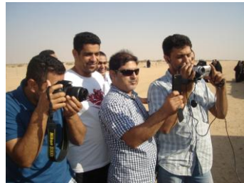
خلني أنا اللي بصور