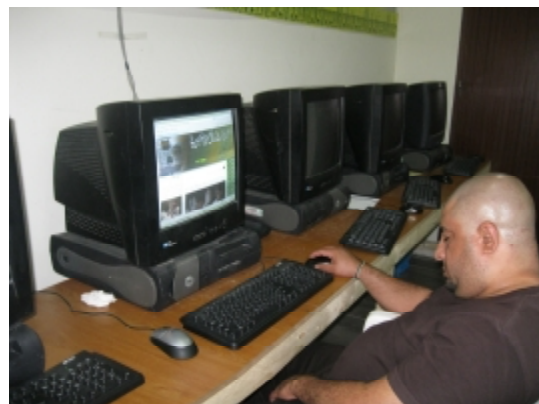
تعبان الفقير، بس اشلون نام وهو ماسك الماوس