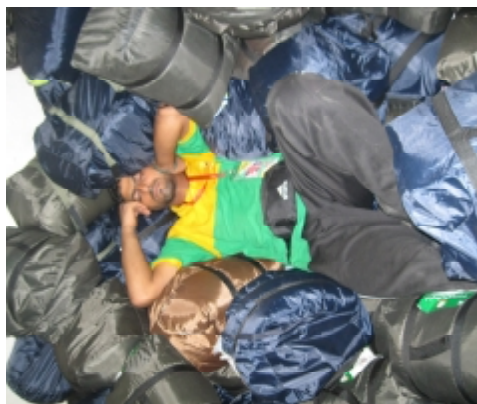
صدق النوم سلطان، ما يعرف وين يسدحك