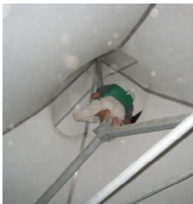
ويش معلقته فوق ..

الجدير بالذكر أن هذه فرقة التواشيح من مدينة الأهواز الإيرانية وتأسست منذ خمسة عشر عاماً، وشاركت في العديد من المحافل بمختلف المدن الإيرانية، وكان لقافلة المحجبي شرف استضافتها في أشرف البقاع على وجه في ليلة الثاني عشر من ذي الحجة.